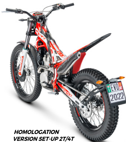
HOMOLOGATION VERSION SET-UP 2T/4T