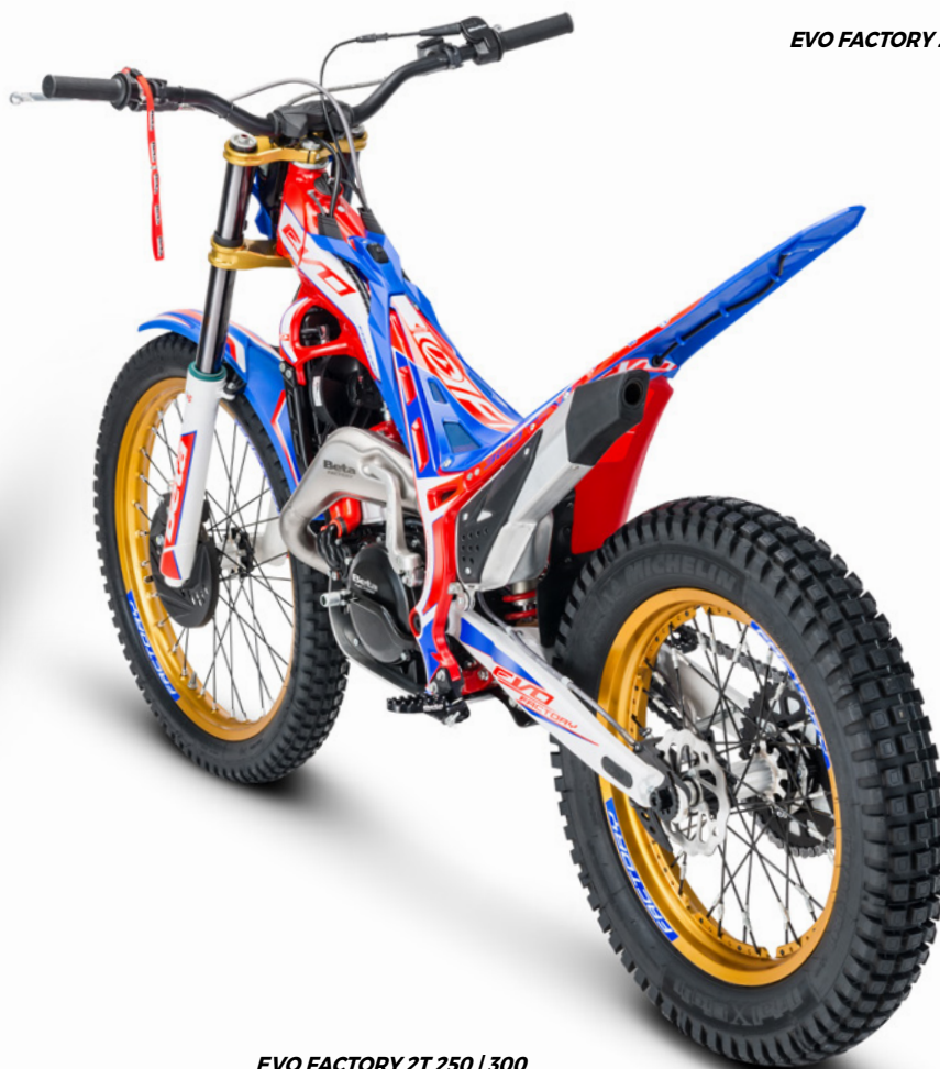
EVO FACTORY 2T 250 | 300